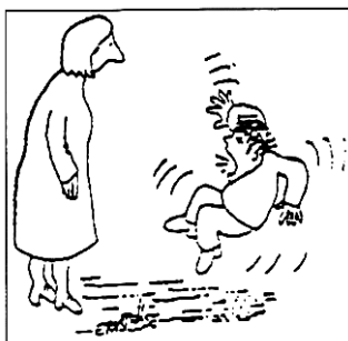
„Erzieh mich doch, erzieh mich doch!“